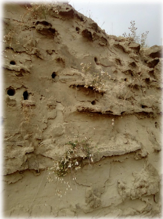
Alcune foto nell'area della Cava Pianelli